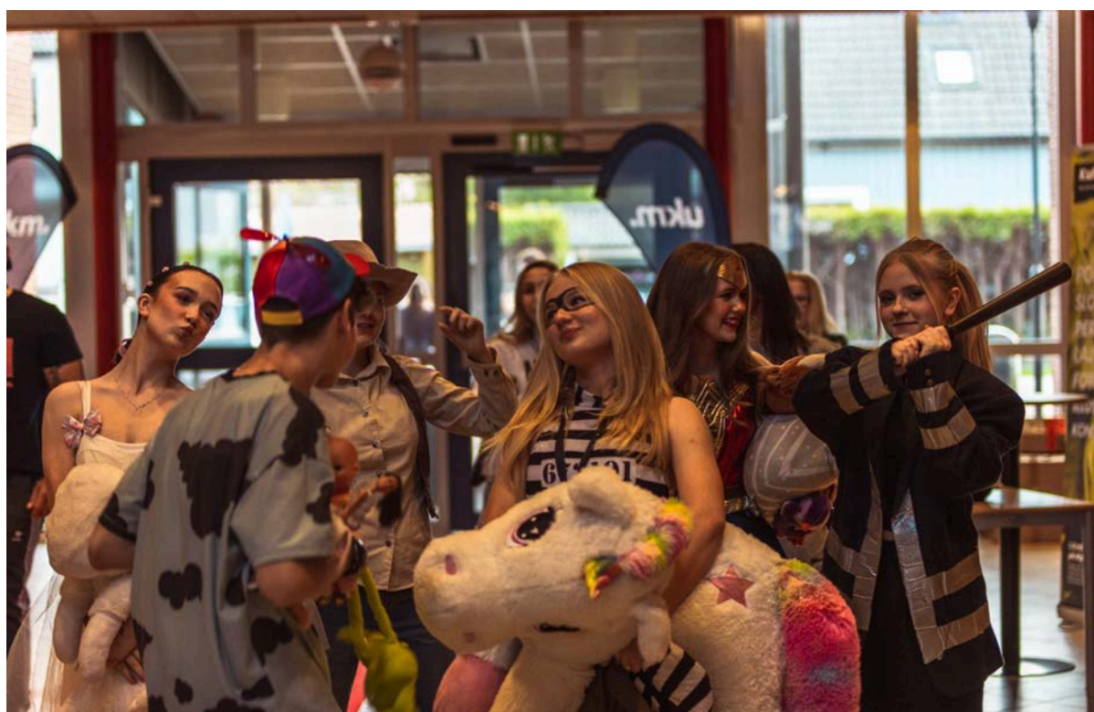
Regionsfinalen av UKM 2023.