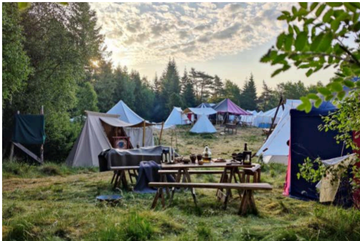
K-pengar projektet “Morgondagens Gryning 10 - Bortom Solnedgången”

Lajvet fick medelbetyg 9,2/10 i deltagarutvärderingen. Bortom Solnedgången beviljades 25 000 kronor och arrangerades av den ideella föreningen Orion i ett skogsområde utanför Kinna med 333 deltagare.