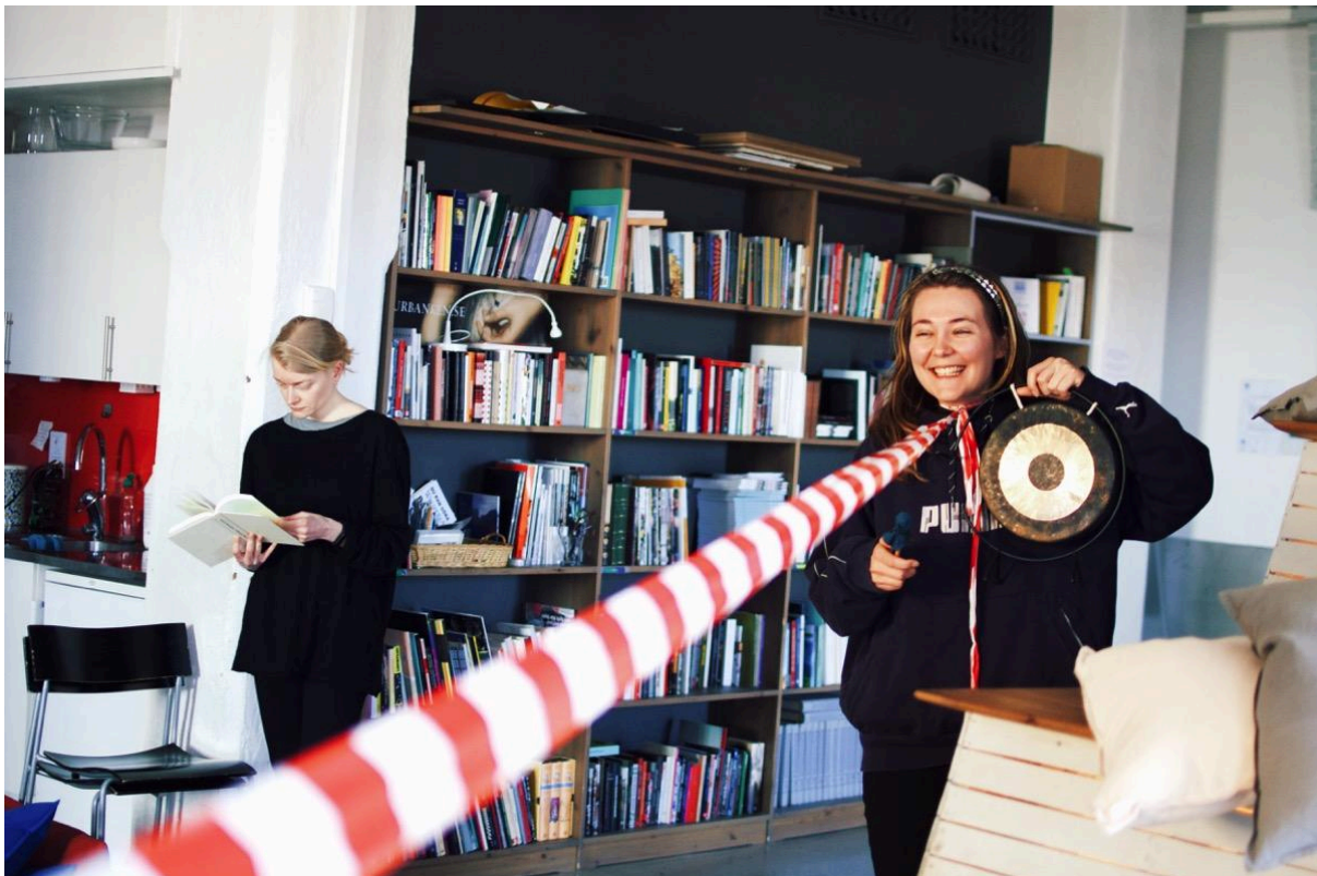
Workshop - Skönheten i kaos